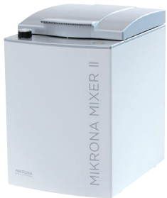
ミクロナミキサーⅡ