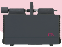
ビタ バキュームポンプ