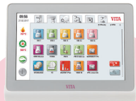
vPad コンフォート 2