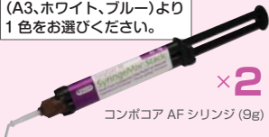
コンポコア AF シリンジ (9g)