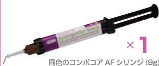
同色のコンポコア AF シリンジ (9g)